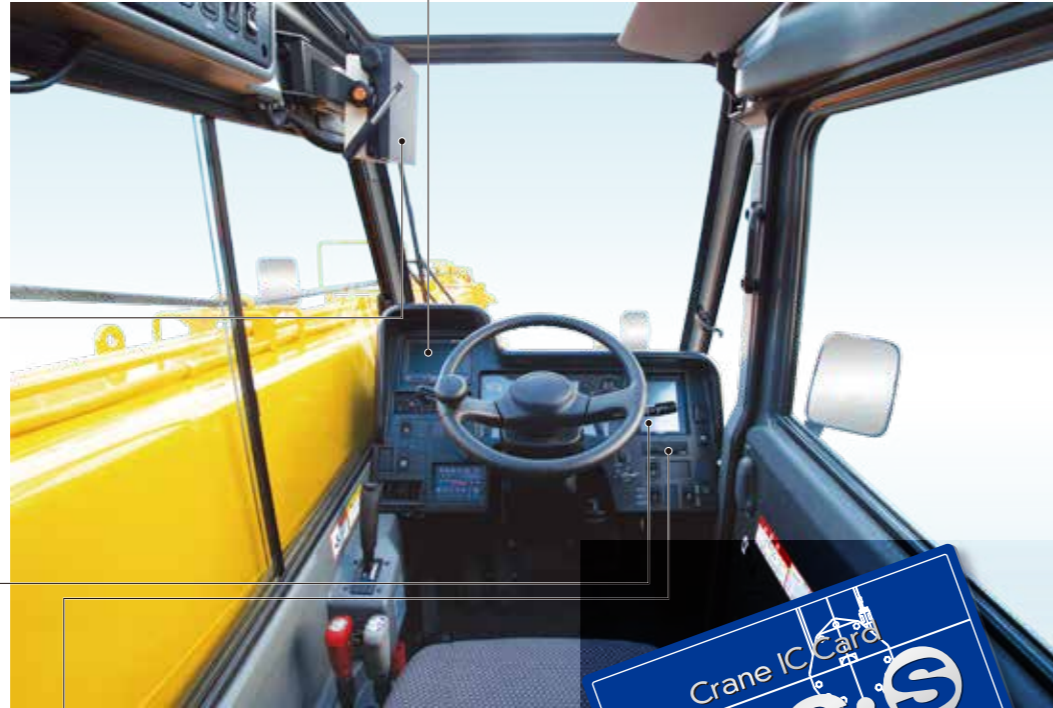
●カラーモニター(オプション)

左方視界の良さは、MRの一大特長。スラントブームとラウンド形状が相まって、左方・前方・上方視界ともに開放感を増しました。