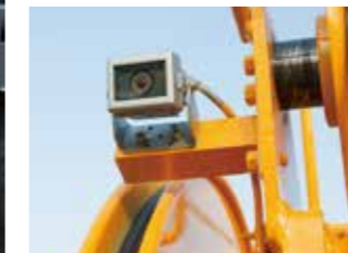
▲後方確認カメラ(オプション)※