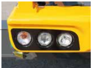
▲丸型プロジェクタータイプヘッドランプ (ディスチャージはオプション)