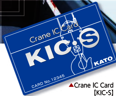
▲Crane IC Card [KIC-S]