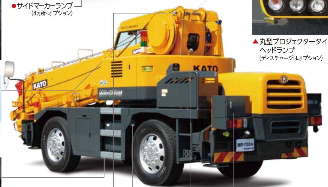
●路肩灯(オプション)