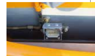
▲ウインチ確認カメラ(オプション)※